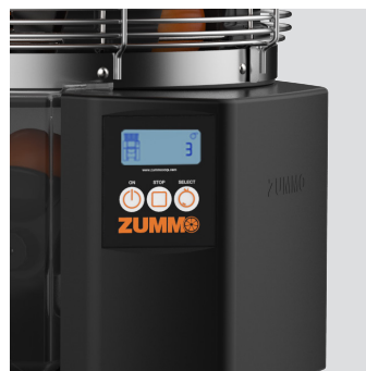
Mayor velocidad de exprimido